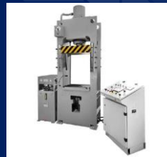
Пресс гидравлический рамного типа модели ДЕ2430.01