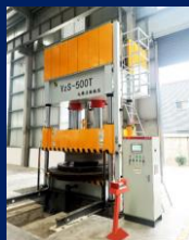
Четырехколонный гидравлический пресс Yz32-500T