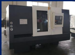
Slant bed cnc lathe machine MODEL : DZ-D56