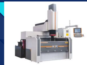
Копировально – прошивные станки серии НГ100