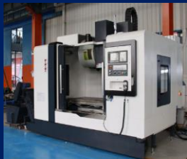
Vertical machining center MODEL : BHJ-2911

В 2022 - 2023 году ОАО Минский завод «ТЕРМОПЛАСТ» обновил оборудование. Современные станки и линии предназначены для производства сложных деталей из различного вида металлов в условиях индивидуального и серийного производства.