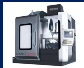
Обрабатывающий центр с ЧПУ СМС650и